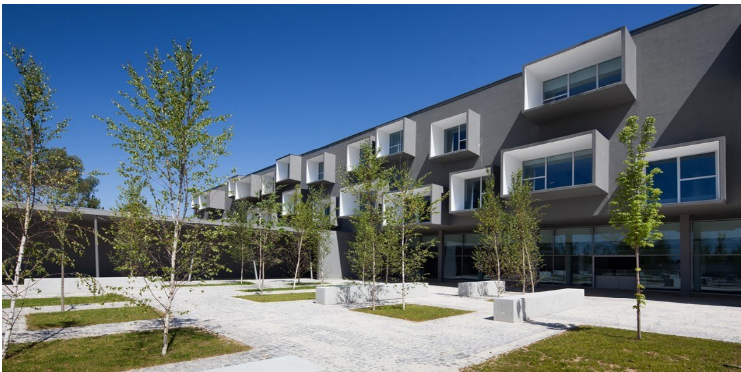
Partnerių mokykla Agrupamento de Escolas Soares Basto